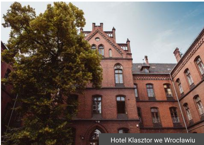
Hotel Klasztor we Wrocławiu