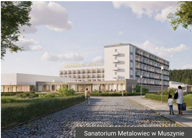
Sanatorium Metalowiec w Muszynie