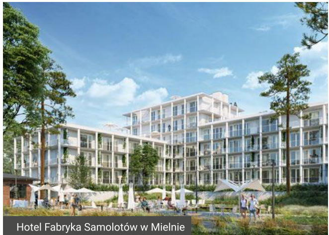
Hotel Fabryka Samolotów w Mielnie