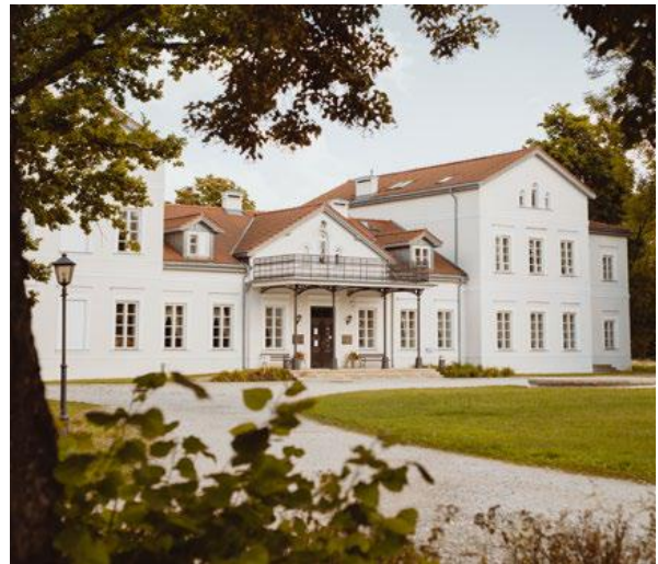
Pałac Łochów kiedyś i dziś