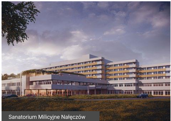
Sanatorium Milicyjne Nałęczów