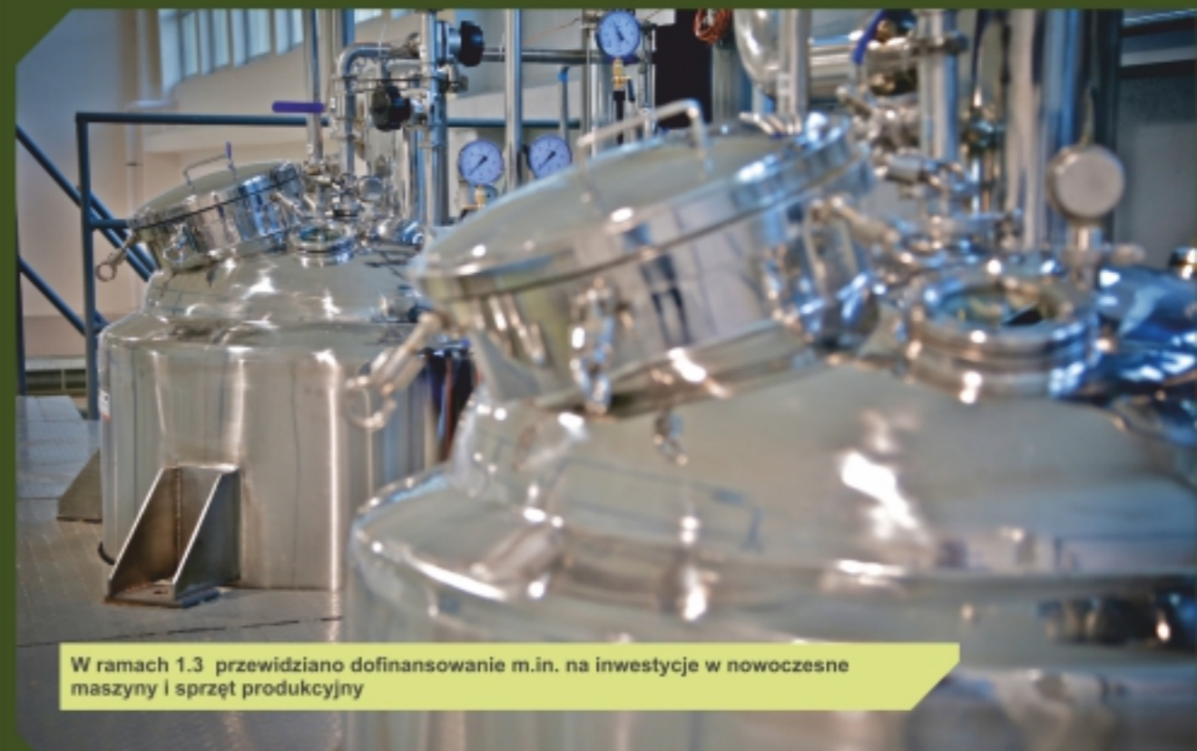
W ramach 1.3 przewidziano dofinansowanie m.in. na inwestycje w nowoczesne maszyny i sprzęt produkcyjny

Maksymalny poziom dofinansowania inwestycji to dla mikro- i małych przedsiębiorstw – do 70 proc. wydatków kwalifikowalnych, a dla średnich przedsiębiorstw – do 60 proc. wydatków kwalifikowalnych. Planowany termin rozstrzygnięcia konkursu to marzec 2017 r.