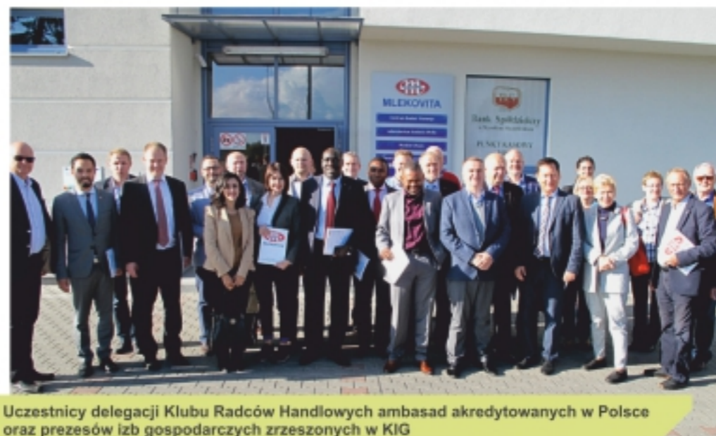
Uczestnicy delegacji Klubu Radców Handlowych ambasad akredytowanych w Polsce oraz prezesów izb gospodarczych zrzeszonych w KIG

Zagraniczni goście w ramach prezentacji walorów gospodarczych województwa podlaskiego zwiedzali lokalne firmy, stanowiące wizytówkę naszego regionu. Zorganizowane zostały wizyty w Spółdzielni Mleczarskiej MLEKOVITA – krajowego lidera produkcji wyrobów mlecznych, firmie SaMASZ Sp. z o.o., produkującej maszyny rolnicze i komunalne oraz w firmie ChM Sp. z o.o., będącej producentem implantów medycznych. Wizyty były okazją do zwiedzenia wizytowanych firm, poznania ich potencjału technologicznego i wytwórczego, prezentacji linii produkcyjnych. Stanowiły również okazję do dyskusji o kierunkach i perspektywach potencjalnej współpracy gospodarczej wyżej wymienionych firm z reprezentowanymi przez dyplomatów krajami.