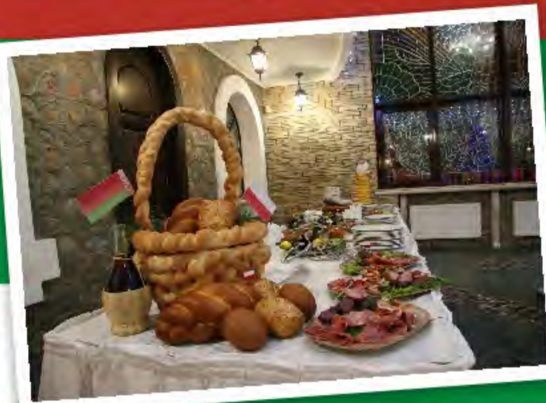
Degustacja potraw polskich i białoruskich

B iałoruś to główny sąsiad województwa podlaskiego. Choć do granicy mamy blisko to wiedza i wyobrażenia o pozycji gospodarczej jest najczęściej rysowana utrwalonymi stereotypami. Nie ma lepszej metody na wyrobienie rzeczywistej opinii o walorach danego kraju, jak jego odwiedzenie. Taka idea przyświecała misji podlaskich przedsiębiorców do Grodna. Miała ona miejsce w dniach 8-9 grudnia br. Jej organizatorami, na zlecenie Urzędu Marszałkowskiego Województwa Podlaskiego, była Izba Przemysłowo-Handlowa w Białymstoku w partnerstwie z Grodzieńskim Oddziałem Białoruskiej Izby Przemysłowo-Handlowej.