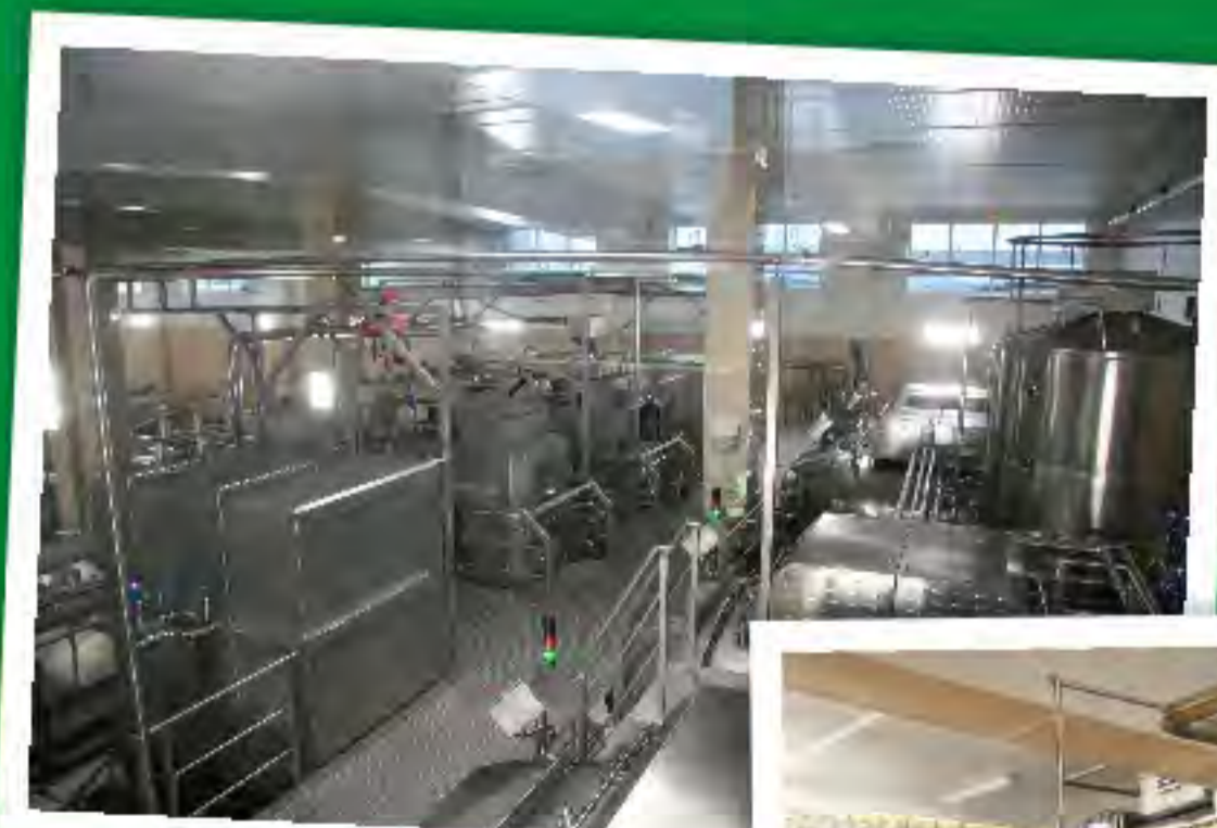
Zwiedzanie mleczarni OAO Mołocznyj Mir