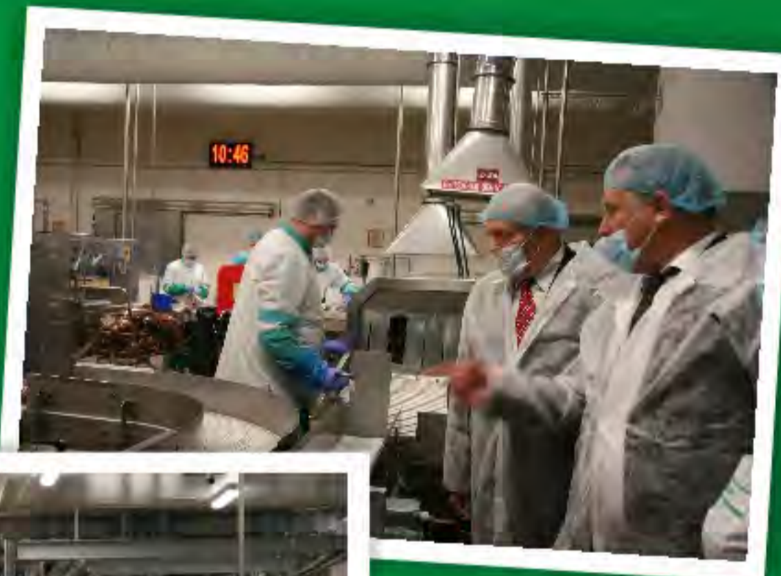
Zwiedzanie zakładów mięsnych OAO Grodzieńskij Miasokombinat

Jak praktycznie wygląda białoruska gospodarka uczestnicy wyjazdu mieli okazję przekonać się podczas bezpośrednich wizyt w zakładach. Wizyty miały miejsce z zakładach mięsnych OAO Grodzieńskij Miasokombinat oraz zakładach mleczarskich OAO Mołocznyj Mir. Technologia produkcji bardzo pozytywnie zaskoczyła zwiedzających. Dorównują czołowym firmom z branży zarówno pod kątem zaawansowanej technologii, stopnia bezpieczeństwa jak również walorów smakowych wytwarzanych produktów. Zarówno strona polska jak i białoruska mają swoje atuty, swoje specjalizacje, mają czym się pochwalić. Nie zmienia to faktu, że jeszcze wiele jest do zrobienia i wiele możliwości do rozwoju wspólnych biznesów. Wielu uczestników misji na nowo odkryło Białoruś, kraj który pozornie bardzo dobrze znali.