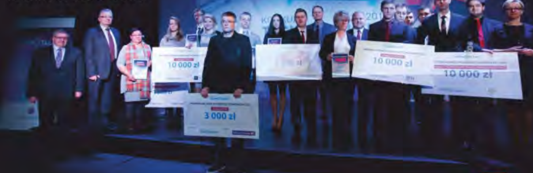
Laureaci Konkursu Technotalent 2016

Już wkrótce zaczynamy przygotowania do IV edycji Konkursu Technotalent 2017. Jesteśmy przekonani, że w 2017 roku uczestnicy konkursu zaprezentują pracę, które będą mogły być wizytówką regionu.