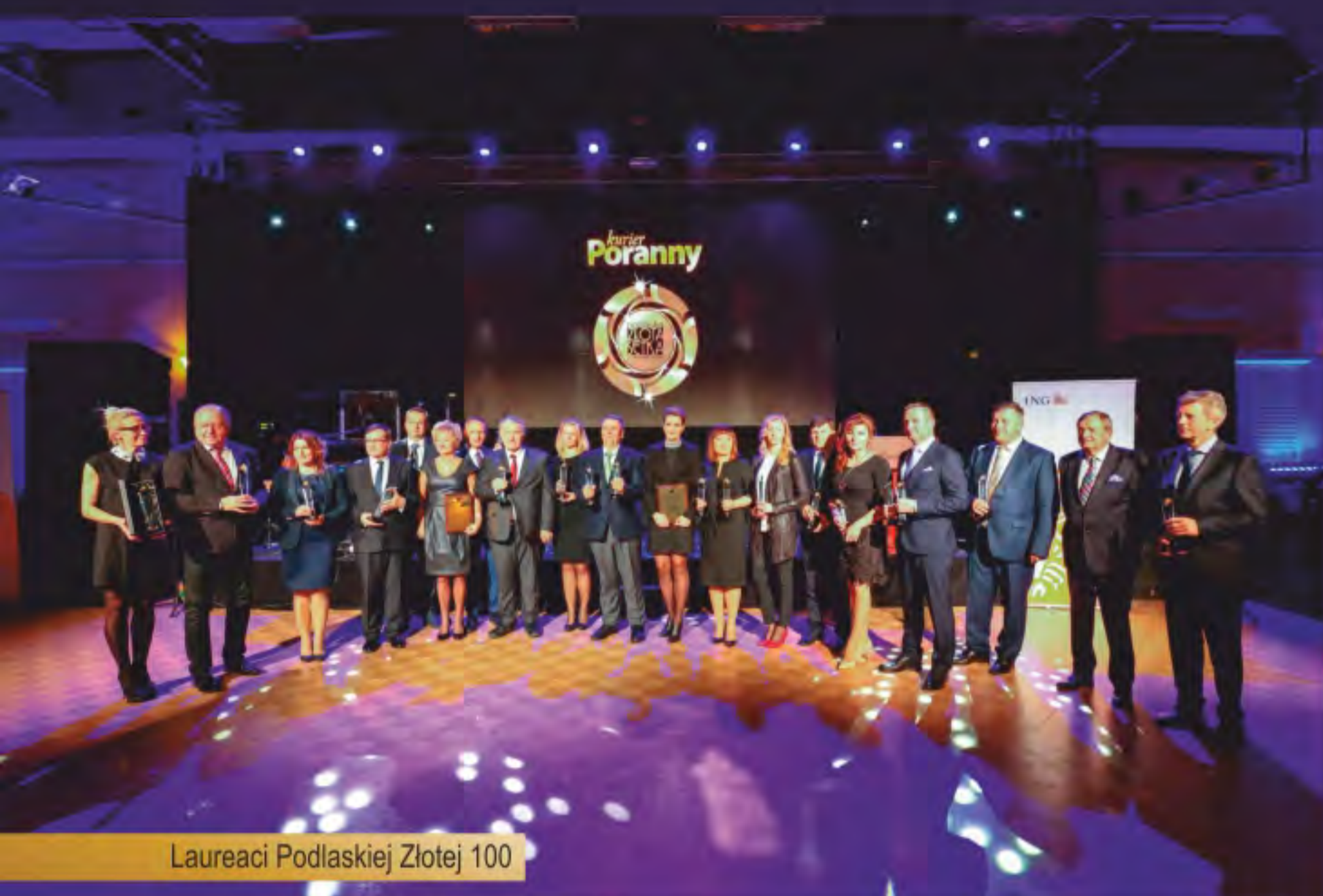
Laureaci Podlaskiej Złotej 100

Za nami 13. edycja Podlaskiej Złotej Setki Przedsiębiorstw